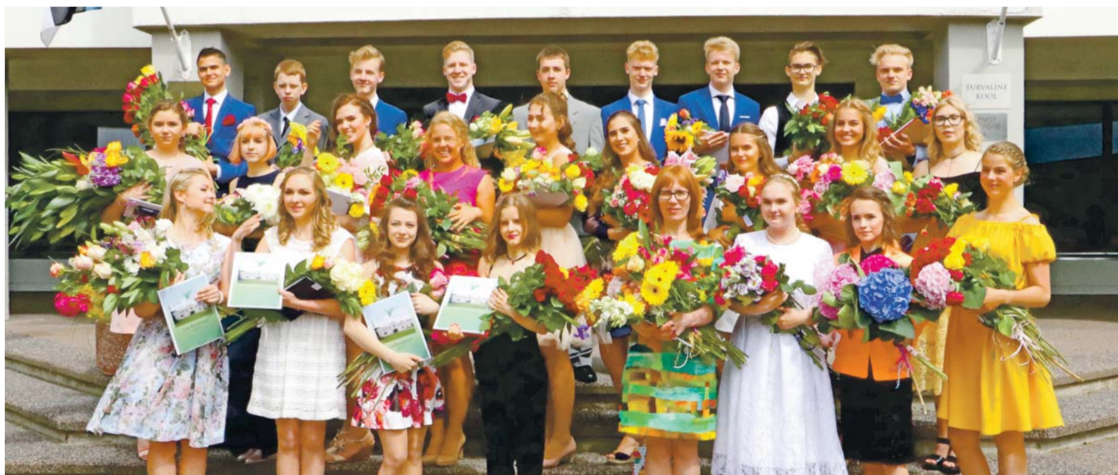
Loo kooli 9. klass