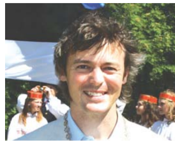
Art Kuum vallavolikogu esimees

küla külaplatsi muinsuskaitse aluse varem konserveerimise I etapp" • Rebala Kultuuriruum MTÜ-le 1700 eurot projektile "Vandjala külaplats X etapp" • Rebala Kultuuriruum MTÜ-le 1800 eurot projektile "Pärimussuvi 2017" • Ajaveski MTÜ-le 2000 eurot projektile "Ajaveski abi- ja laoruum õuealal" • Kaberneeme Klubi MTÜ-le 2000 eurot projektile "Kaberneeme depoohoone kütteseadmed" • Manniva külaselts MTÜ-le 1350 eurot projektile "Manniva külaplats V etapp" • Jõelähtme rahvarõivaste selts MTÜ-le 750 eurot projektile "Näputöökambris uut ja vanat"