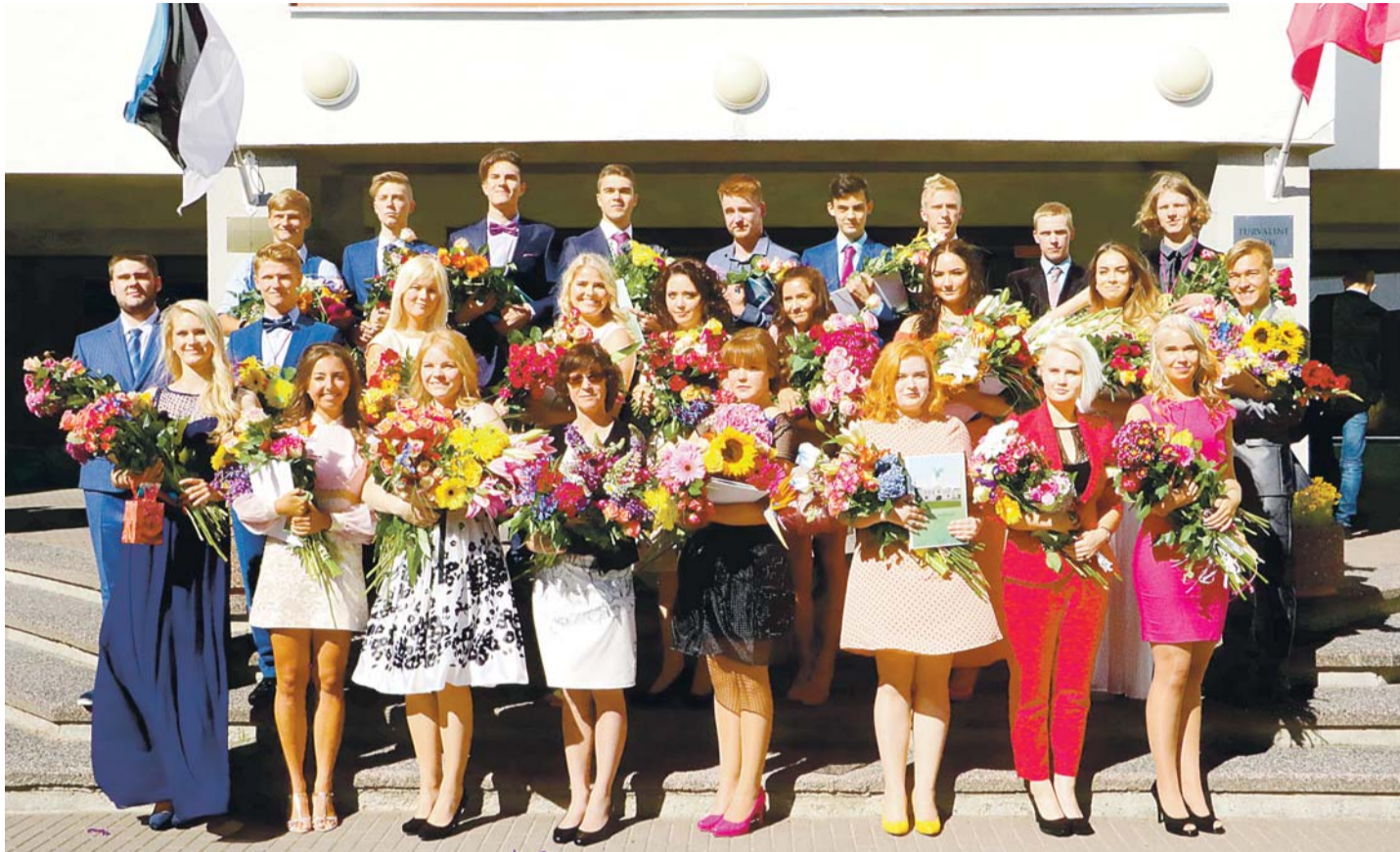
Loo kooli 12. klass