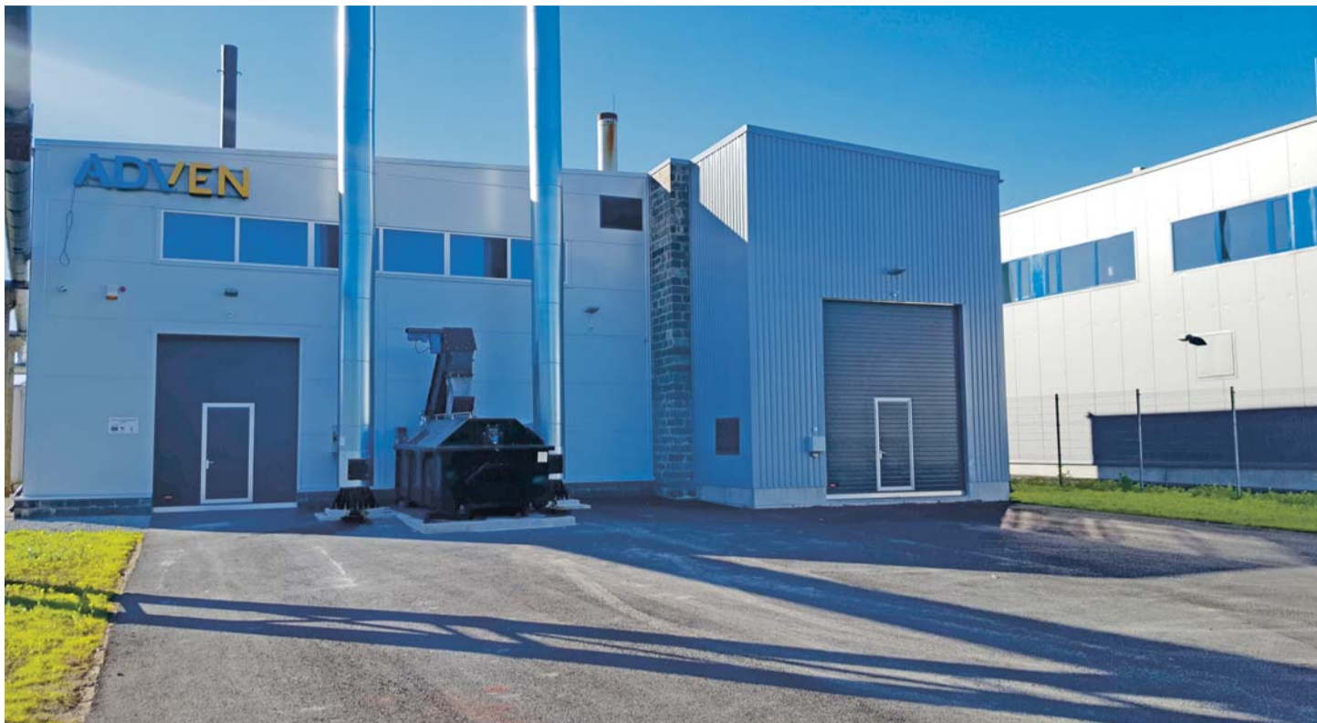
Loo katlamaja juunis.