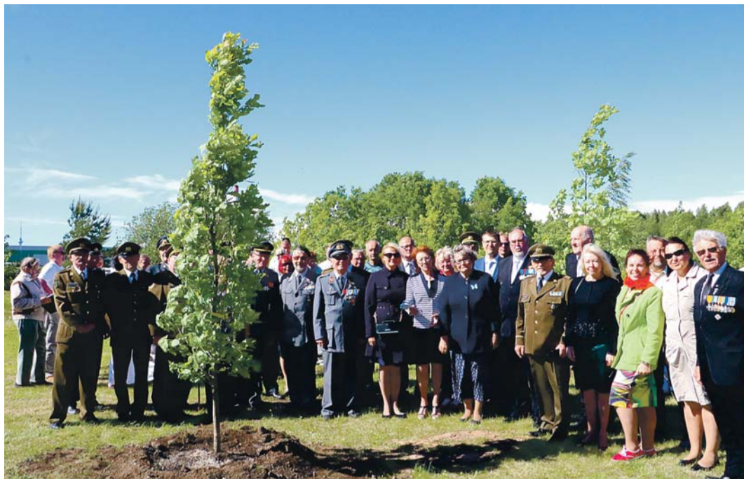
Tammepuu istutamine Vabaduse hiide.

Täpsed ajutised liikluskorralduslikud lahendused selguvad enne ehitustöödega alustamist. Suuremas osas teostatakse töid olemasoleva tee kõrval. Põhimaanteel toimuvad piirde ning märgistustööd. Liigeldes juhitud tööd ajaks paigaldatud ajutistest liikluskorraldusvahenditest. Ehitustööde tulemusena valmib Tallinna-Narva maantee 17,2–18,7 km kõrvale kogujatee, mis ühendab Loovälja lõunaringi ja Maardu-Raasiku maanteed.