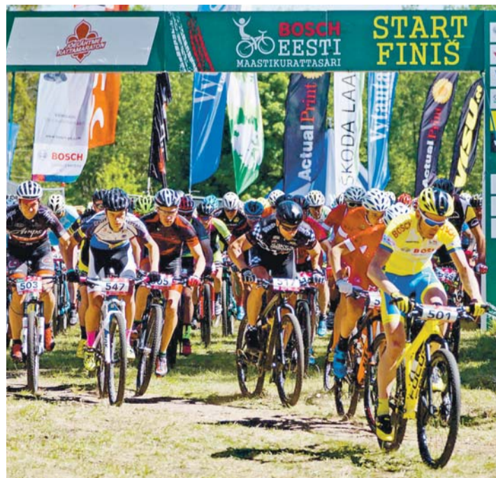
Jõelähtme maratoni 50 km distantsi start.