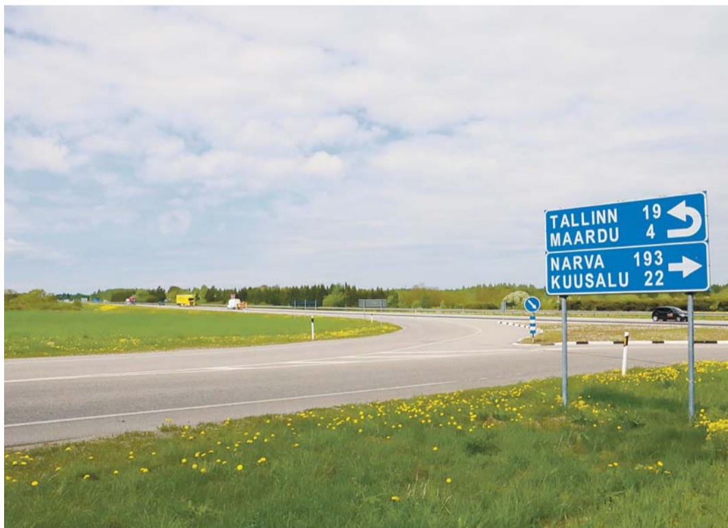
Ohtlik tagasipööre Tallinna suunas likvideeritakse.

servistide Liit panid kasvama kaks tamme: üks tänavuse maakaitsepäeva korraldaja Kiili valla poolt ja teine Soome Vabariigi 100. juubeli auks. Mälestuskivile kinnitati sepistatud tahvel Soome Vabariigi ja Kiili valla nimega. Järgmisest aastast alates võtab Harju maavalitsuse initsiatiivi üle tõenäoliselt Harju Omavalitsuse Liit.