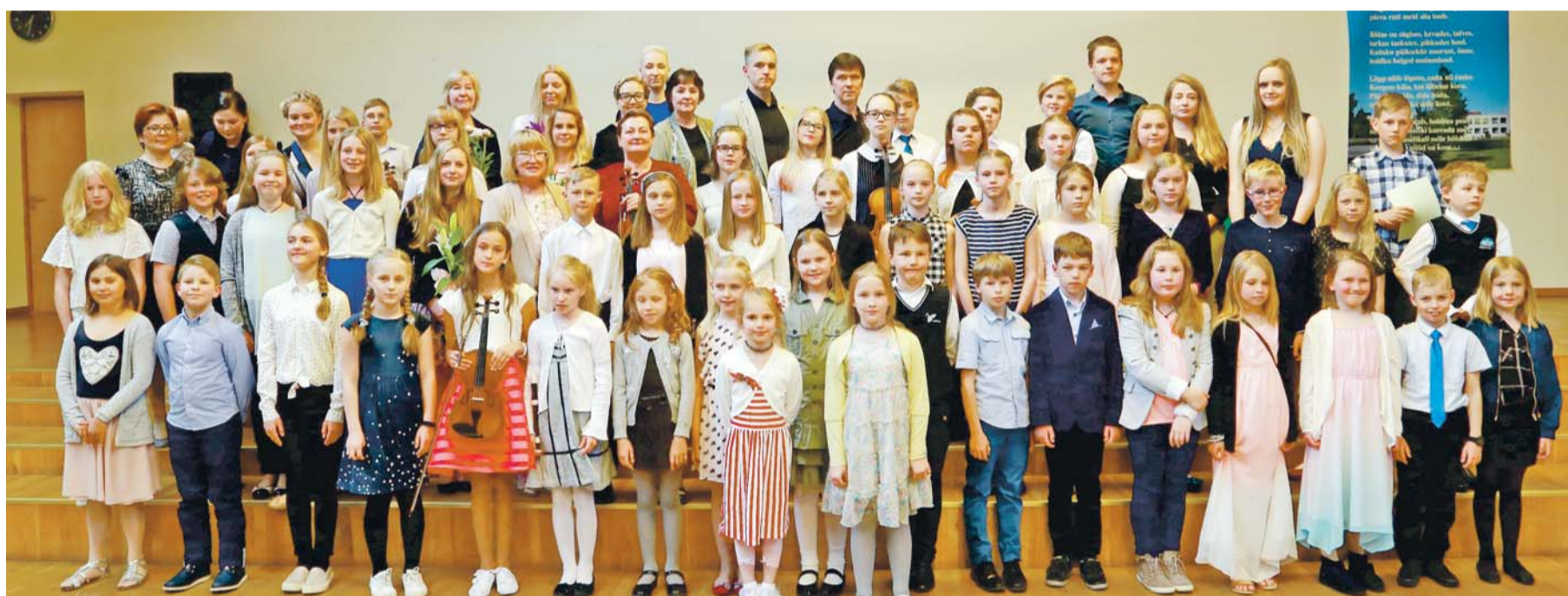
Muusikakooli lõpuaktus.