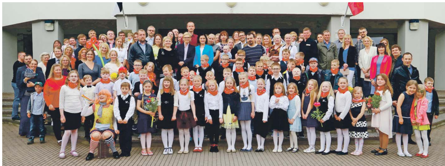
Loo kooli 1. klasside lõpuaktus.