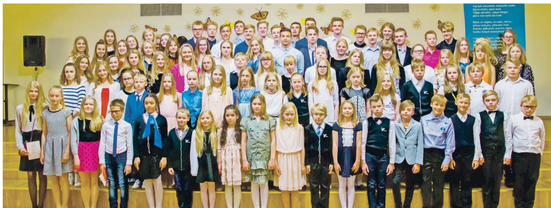
Valla tublide õpilaste vastuvõtt Loo koolis.